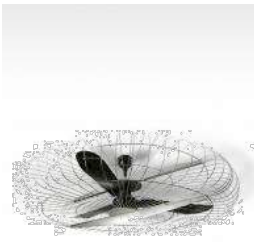
シーリングファン INDUSTRIAL HEAVYWEIGHT CEILING FAN φ1524(フレーム) × h590